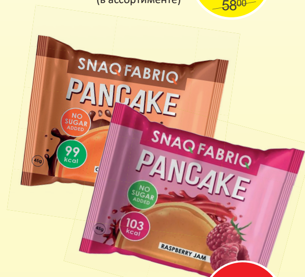
ПАНКЕЙК СЕК ФАБРИК (45г, в ассортименте)