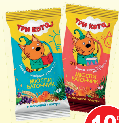
МЮСЛИ БАТОНЧИК ТРИ КОТА (40г, в ассортименте)