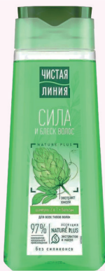
ШАМПУНЬ 2 в 1 (для всех типов волос) 250 мл