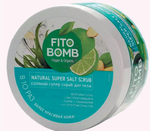
СУПЕР СКРАБ ДЛЯ ТЕЛА СОЛЯНОЙ