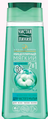
ШАМПУНЬ МИЦЕЛЛЯРНЫЙ 2 в 1 для частого мытья (для всех типов волос) 250 мл