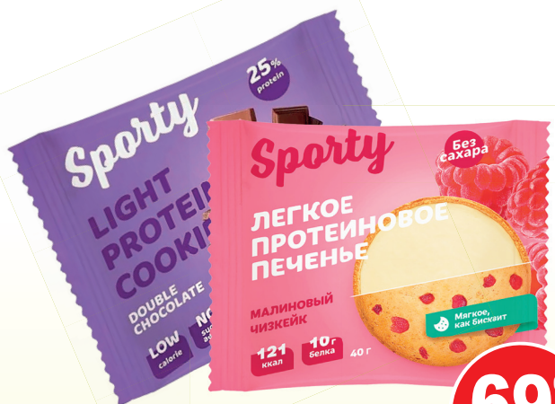
ПЕЧЕНЬЕ ПРОТЕИНОВОЕ СПОРТИ (40г, в ассортименте)