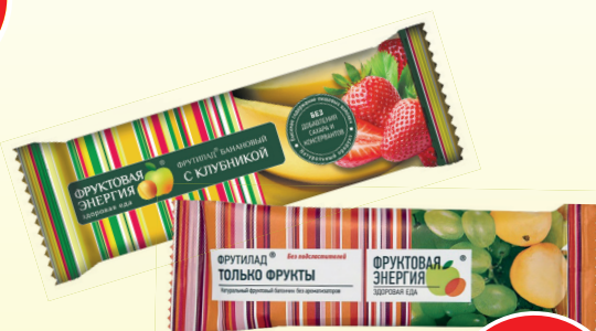
БАТОНЧИК ФРУКТОВЫЙ ФРУТИЛАД (в ассортименте)