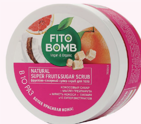
СУПЕР СКРАБ ДЛЯ ТЕЛА ФРУКТОВО-САХАРНЫЙ