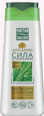
БАЛЬЗАМ для волос УКРЕПЛЯЮЩИЙ (для всех типов волос) 230 мл