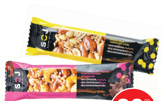
БАТОНЧИК ОРЕХОВЫЙ СОДЖ (в ассортименте)