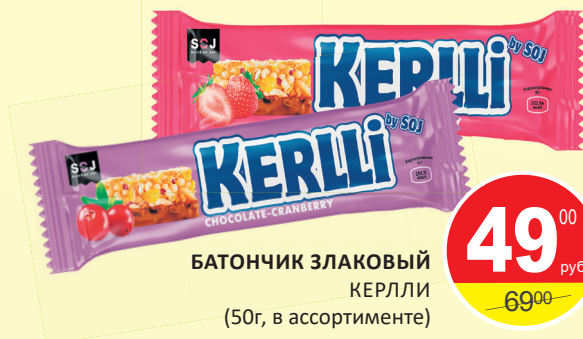
БАТОНЧИК ЗЛАКОВЫЙ КЕРЛИ (50г, в ассортименте)