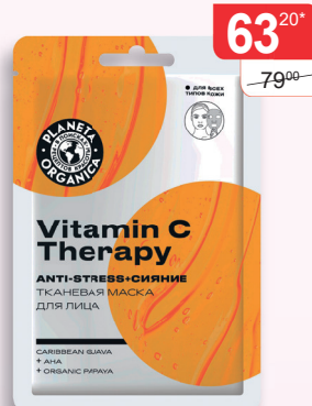
МАСКА ДЛЯ ЛИЦА ТКАНЕВАЯ (С КОЛЛАГЕНОМ)