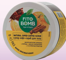
СУПЕР СКРАБ ДЛЯ ТЕЛА КОФЕ